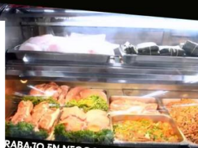
TRABAJO EN NEGOCIOS DETALLISTAS