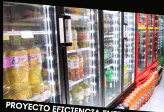
PROYECTO EFICIENCIA ENERGETICA