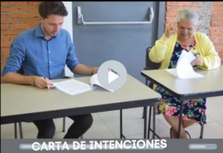
CARTA DE INTENCIONES

Proyecto Acción Clima de la GIZ y Cámara de Detallistas, firman Carta de Intenciones para mejorar la eficiencia energética en equipos de frío, iluminación y otros. Se espera contribuir en la mitigación del cambio climático y bajar costos operativos en negocios detallistas.